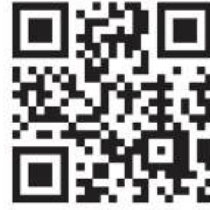
منصة القبول الموحد

*عزيزي المتقدم قد يطرأ بعد التعديلات على التخصصات لذا يرجى الدخول على منصة القبول الموحد باستمرار لمتابعة التحديثات .